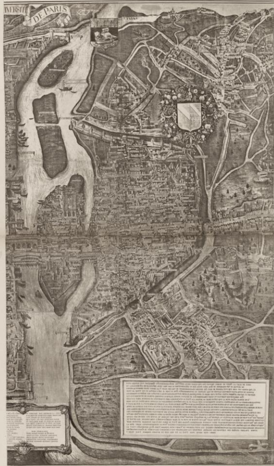
1840 DE 1812 A 1847 Bibliographie de la Ville de Paris